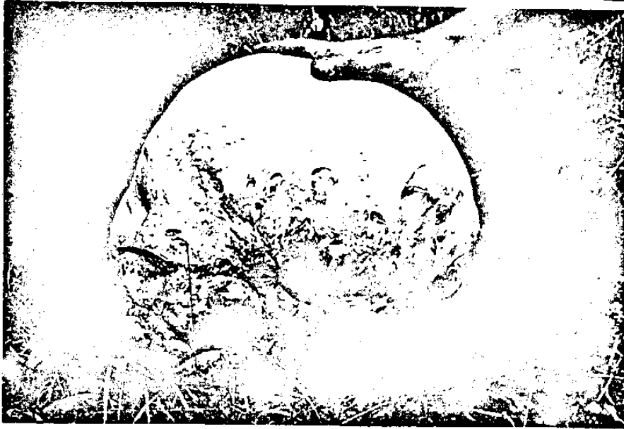
Abb.1. Langermannia maxima . Exemplar gefunden im Holzlager der Unirea-Fabrik in Cluj-Napoca.

Bovista gigantea (BATSCH) NEES, Syst. Pilze Schwäm.:34, tab.11, fig. 124 c, 1817